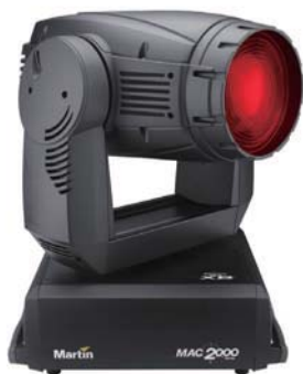
MAC 2000E Wash XB