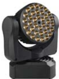
MAC 101 WRM