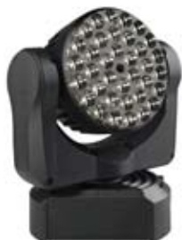
MAC 101 CLD