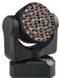
MAC 101 CT